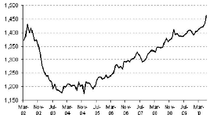
Rendimento médio real