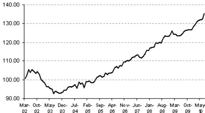
Massa de rendimentos reais